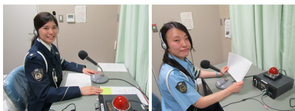
ラジオパーソナリティー (愛知県警察本部 交通総務課)