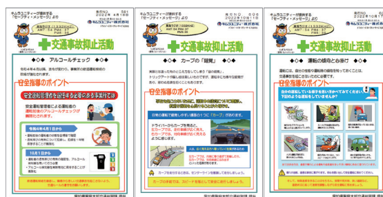
交通安全ニュース (2022 年度の掲載分 抜粋)